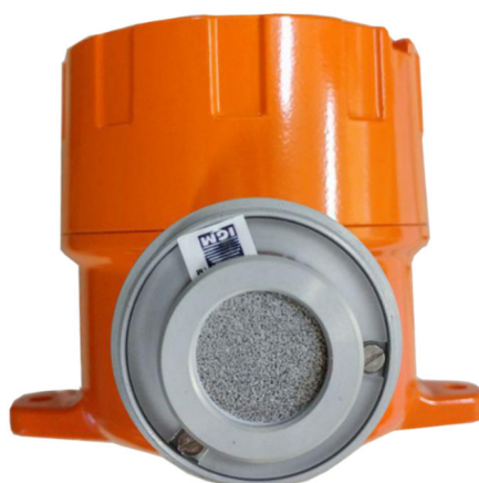
Рисунок 3 – Схема пломбировки от несанкционированного доступа Программное обеспечение.

Влияние встроенного программного обеспечения (далее – ПО) учтено при нормировании метрологических характеристик газоанализаторов. Уровень защиты – «средний» по Р 50.2.077-2014. Идентификационные данные встроенного программного обеспечения газоанализаторов приведено в таблице 1.