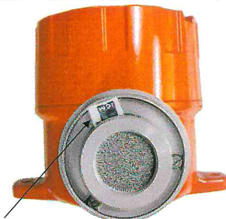
Место нанесения пломбы