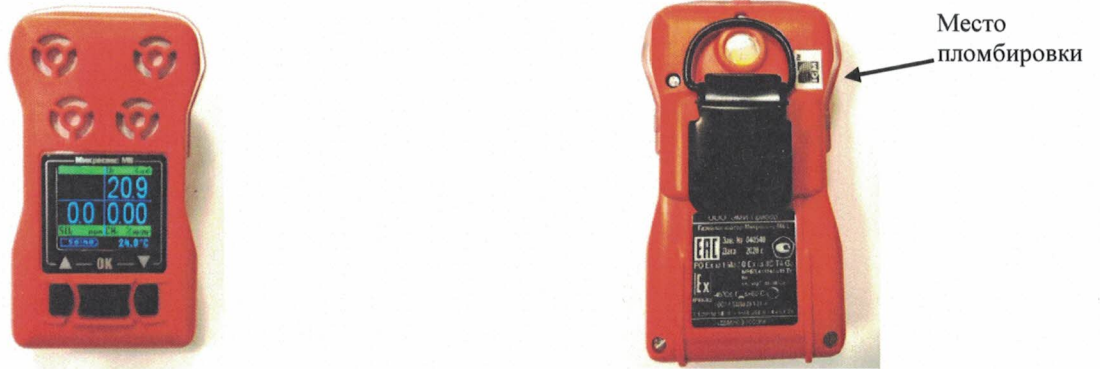
Рисунок 1 –Газоанализаторы портативные Микросенс М6, Микросенс М6.L. Общий вид и место пломбировки.