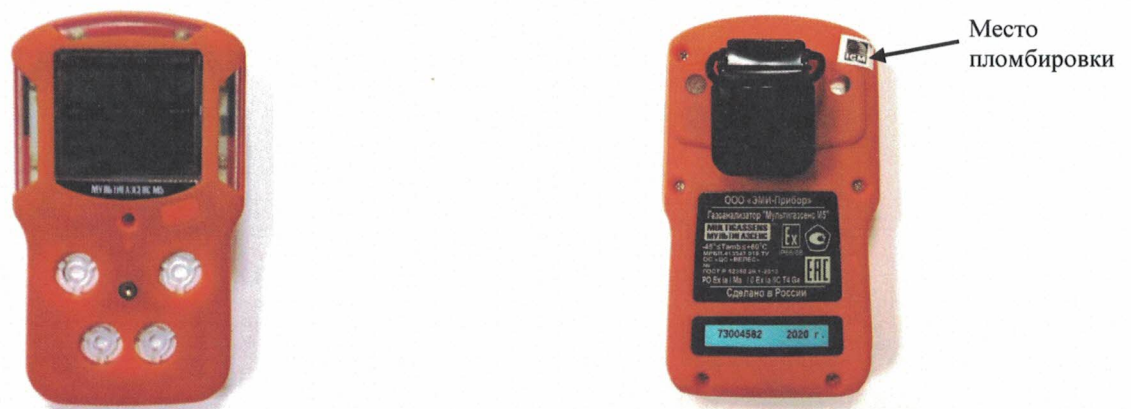
Рисунок 2 –Газоанализаторы портативные Мультигазсенс М5, Мультигазсенс М5.L. Общий вид и место пломбировки.