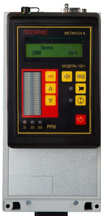
а) модель 1001