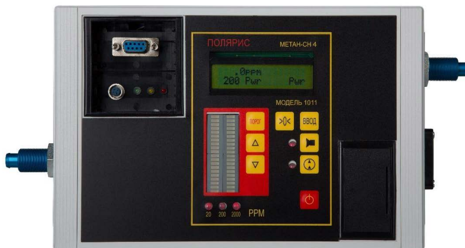
б) модель 1011